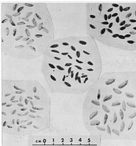
เมล็ดข้าว 5,000-7,000 ปีมาแล้ว จากถ้ำปุงสูง จ. แม่ฮ่องสอน (กลุ่มกลาง) เปรียบเทียบพันธุ์ข้าวปัจจุบันทางภาคตะวันออกเฉียงเหนือของประเทศไทย

นอกจากกินข้าวเป็นอาหารหลักแล้ว ผู้คนยุคนี้อย่างแสวงหาของกินจากความหลากหลายทางชีวภาพตามธรรมชาติของสุวรรณภูมิด้วย จากการขุดค้นทางโบราณคดีพบว่ามีกระดูกสัตว์และซากพืชพันธุ์ฝังรวมในหลุมศพ