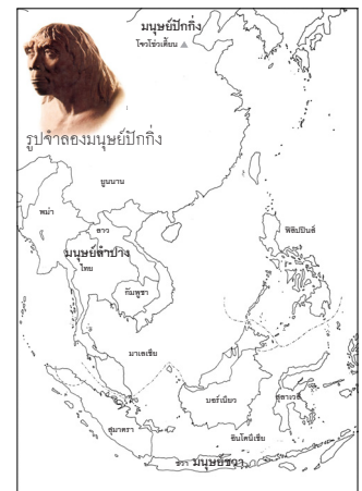
ภาพต้นนิชฐานรูปร่างของโฮโม อีเรคตัส เมื่อ 5 แสนปีมาแล้ว