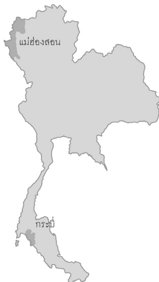
โครงกระดูกมนุษย์ ขุดพบที่เพิงผาบ้านไร่ จ. แม่ฮ่องสอน