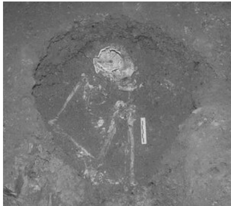
โครงกระดูกมนุษย์ ขุดพบที่เพิงผาถ้ำลอด จ. แม่ฮ่องสอน

สภาพแวดล้อมไม่แตกต่างจากปัจจุบันมากนัก แต่จะมีความหนาแน่นของพืชพรรณในป่าและความชุกชุมของสัตว์ป่ามากกว่าปัจจุบัน