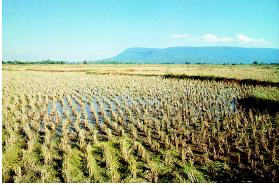
ต้นทิวภูยาวเรียกคอกยัดวัน