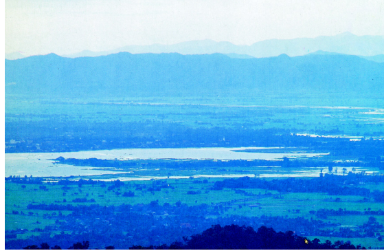
ภูยาว พาดผ่านเมืองพะเยา

พะเยา มาจากชื่อภูยาว หรือภูกามยาว หมายถึงทิวเขาต่อกันเป็นพีคียาว พาดผ่านเมืองพะเยา