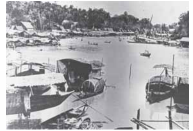
(บน) เรือนแพ ปากคลองบางหลวง เห็นพระปรางค์วัดอรุณ ริมน้ำเจ้าพระยา (ล่าง) เรือนแพและตลาดแพ ที่อยุธยา (ภาพถ่ายสมัยรัชกาลที่ 5)

รูปปกหน้า เรือนแพและตลาดแพ จินตนาการเป็น “บ้านเก่า เหี่ยวร้าง” ของสุนทรภู่เมื่อยังเยาว์อยู่กับแม่ ปากคลอง บางกอกน้อย สมัยต้นกรุงรัตนโกสินทร์ ทำจำลองขึ้นใหม่จาก ภาพถ่ายเก่าซ้อนกัน 2 ภาพ