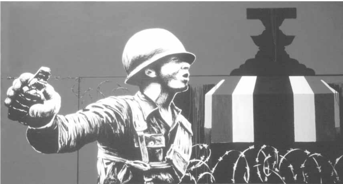
โปสเตอร์การเมือง ผลงานของแนวร่วมศิลปินแห่งประเทศไทย, ศิลปิน : ตระกูล พีรพันธ์