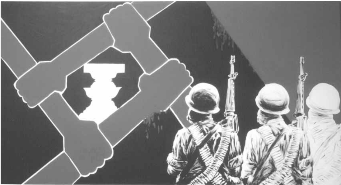
โปสเตอร์การเมือง ผลงานของแนวร่วมศิลปินแห่งประเทศไทย, ศิลปิน : ตระกูล พิรพันธ์