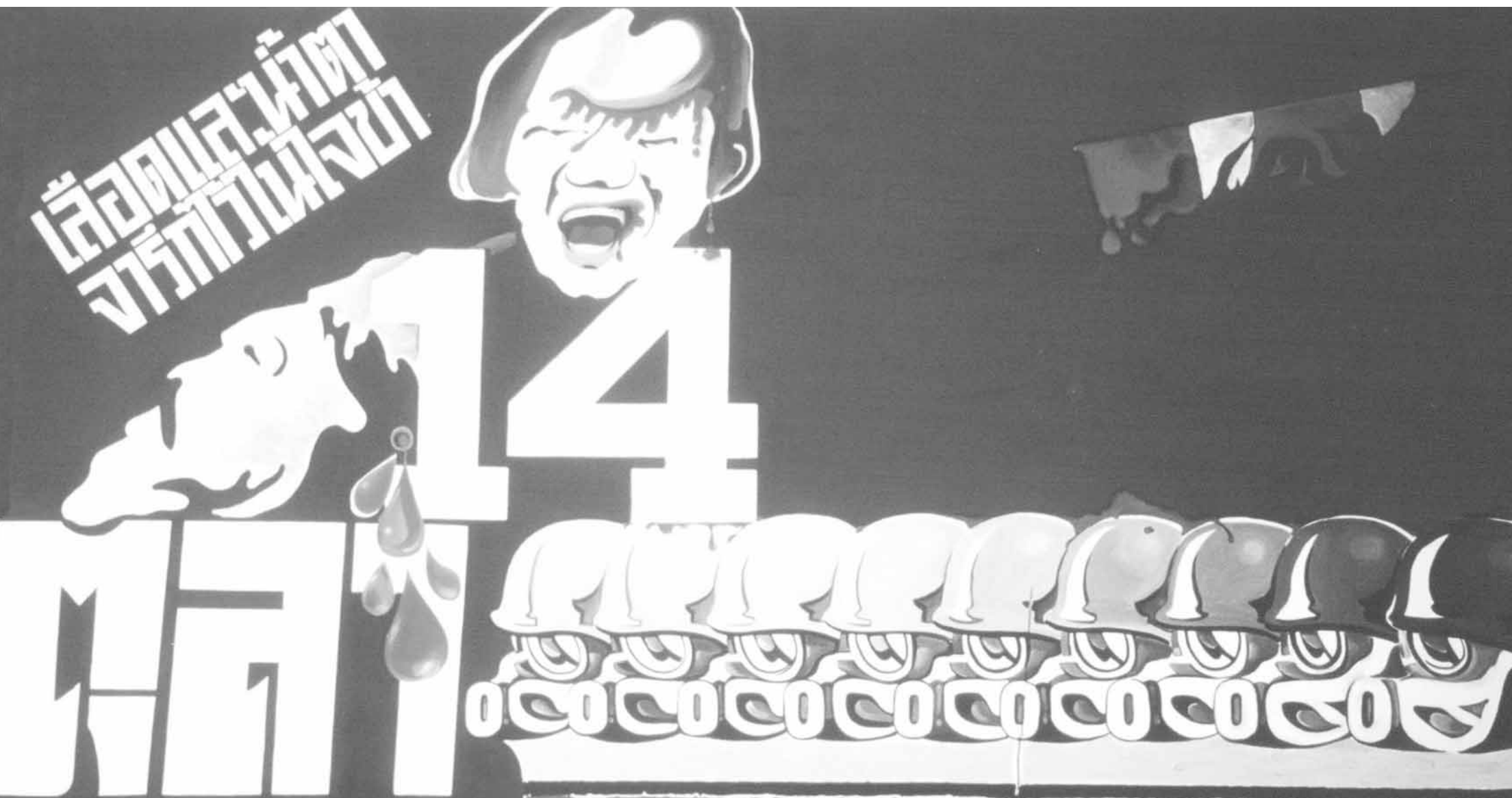
โปสเตอร์การเมือง ผลงานของแนวร่วมศิลปินแห่งประเทศไทย, ศิลปิน : ไม่ทราบชื่อ