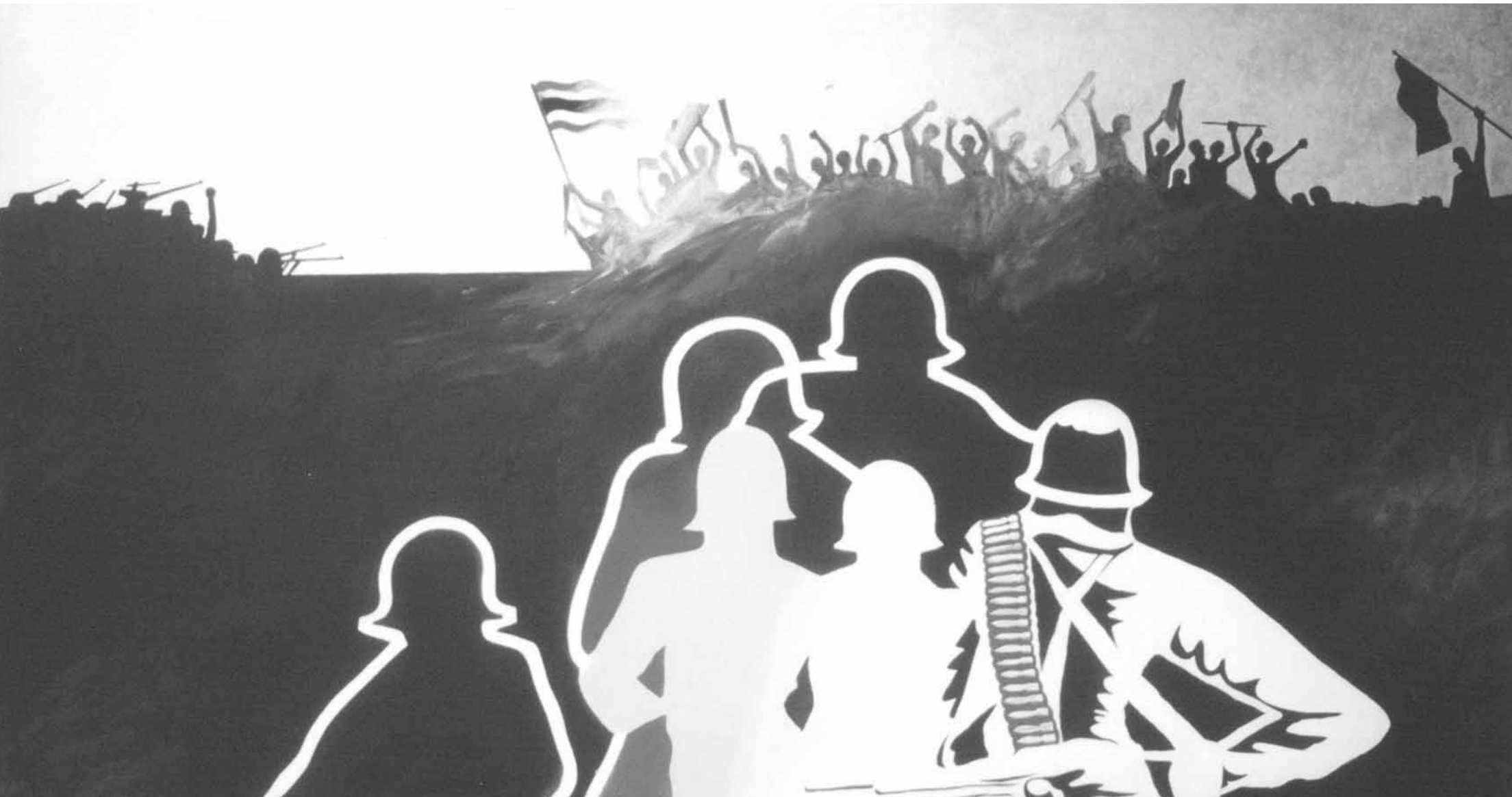
โปสเตอร์การเมือง ผลงานของแนวร่วมศิลปินแห่งประเทศไทย, ศิลปิน : ไม่ทราบชื่อ