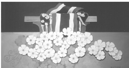
ภาพจากปก

โปสเตอร์การเมือง ผลงานของแนวร่วมศิลปินแห่งประเทศไทย, ศิลปิน : สถาพร ไชยเศรษฐ์