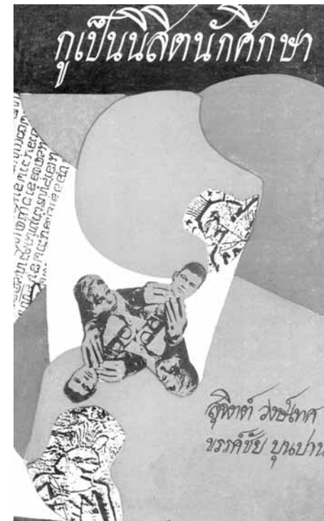
ปกหนังสือ กูเป็นนิสิตนักศึกษา เมื่อพิมพ์ครั้งแรก ๒๕๑๒

ชาญวิทย์ เกษตรศิริ อธิษากะ นวยอรั้ง เมษายน ๒๕๒๔