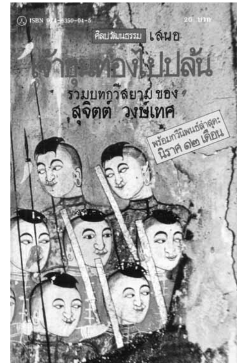
ปกหนังสือ เจ้าขุนทองไปปล้น เมื่อพิมพ์ครั้งแรก ๒๕๒๔

(พิมพ์ครั้งแรก เป็น คำนำเสนอ ในหนังสือ เจ้าขุนทองไปปล้น, ๒๕๒๔)