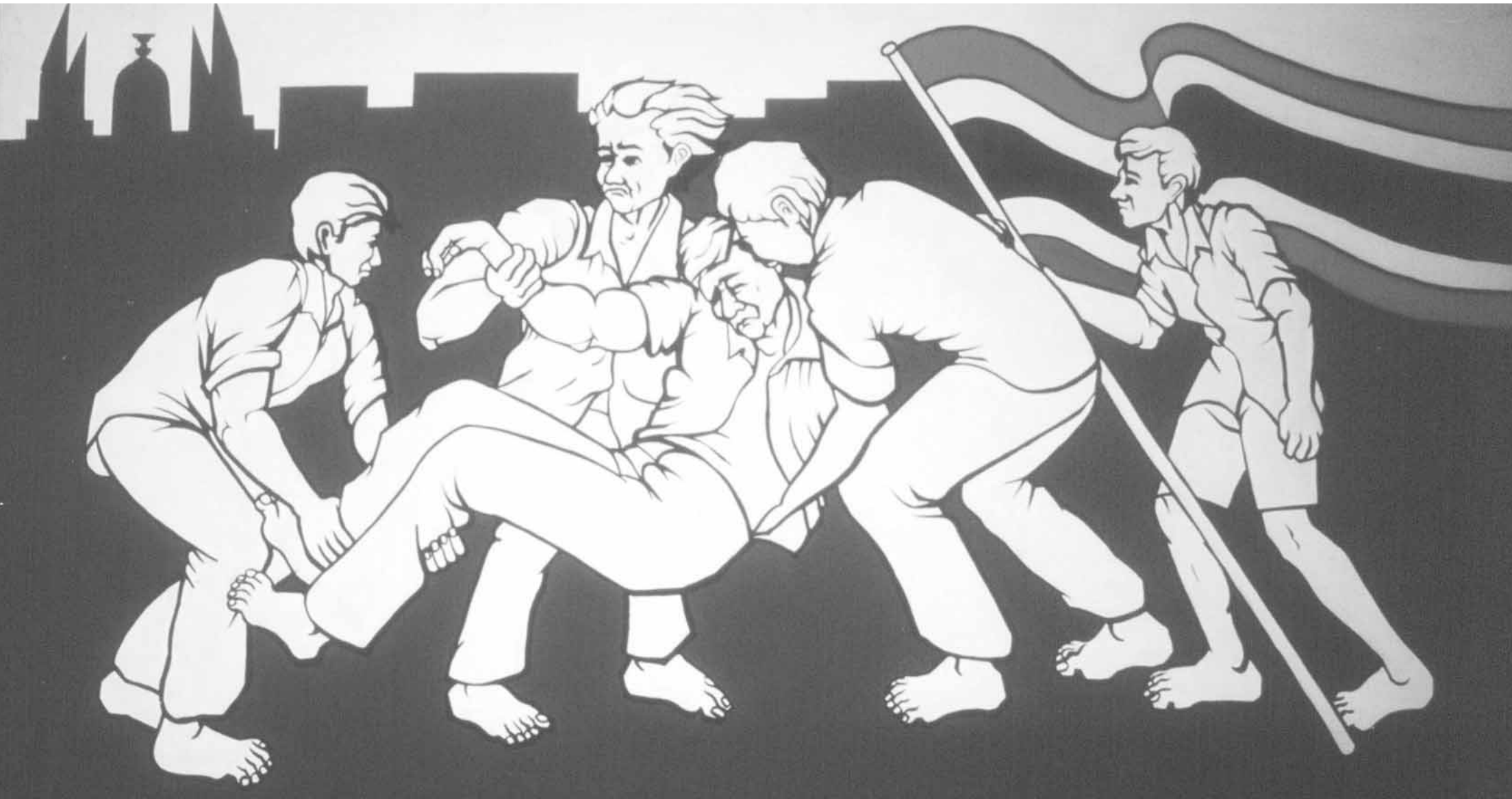
โปสเตอร์การเมือง ผลงานของแนวร่วมศิลปินแห่งประเทศไทย, ศิลปิน : สิงห์น้อย พุสวัตต์สถาพร