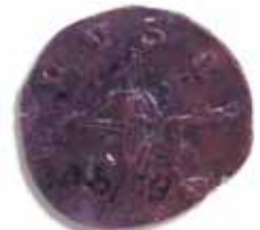
ตราประทับดินเผาสัญลักษณ์ทางศาสนา-การเมือง ประกอบอักษรจารึก พบที่เมืองอู่ทอง อ. อู่ทอง จ. สุพรรณบุรี