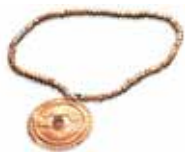
สร้อยลูกปัดทองคำพร้อมจี้สัญลักษณ์ของผู้มีอำนาจทางการเมือง พบที่เมืองอู่ทอง อ. อู่ทอง จ. สุพรรณบุรี

เหรียญโรมัน พบที่เมืองอู่ทอง อ. อู่ทอง จ. สุพรรณบุรี นักโบราณคดีกรมศิลปากรอธิบายว่า ด้านหน้ามีรูปพระพักตร์ด้านข้างของจักรพรรดิซีซาร์ วิคโตรินุส (กษัตริย์โรมัน ครองราชย์ระหว่างปี พ.ศ. 812-814) สวมมงกุฎยอดแหลมเป็นแฉก มีตัวอักษรล้อมรอบอยู่ริมขอบของเหรียญ IMP C VICTORINUS PF AUG ซึ่งเป็นคำย่อของ Imperator Caesar Victorinus Pius Felix Auguste แปลว่า จักรพรรดิซีซาร์ วิคโตรินุส ศรีทศา ความสุข เป็นสง่า ส่วนด้านหลังของเหรียญเป็นรูปของเทพีอาธินา (รูปและคำอธิบายของกรมศิลปากร)