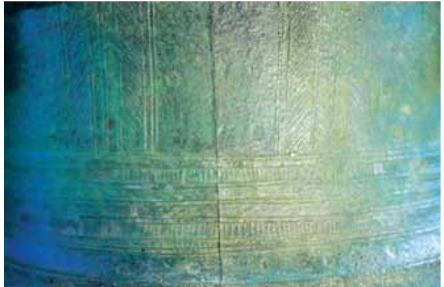
กลองทองหรือกลองมโหระทึก อายุราว 3,000 ปีมาแล้ว พบที่บ้านชีทวน อ. เชื่องใน จ. อุบลราชธานี (ภาพจากหนังสือ เมืองอุบลราชธานี , กรมศิลปากร จัดพิมพ์เมื่อ พ.ศ. 2532)