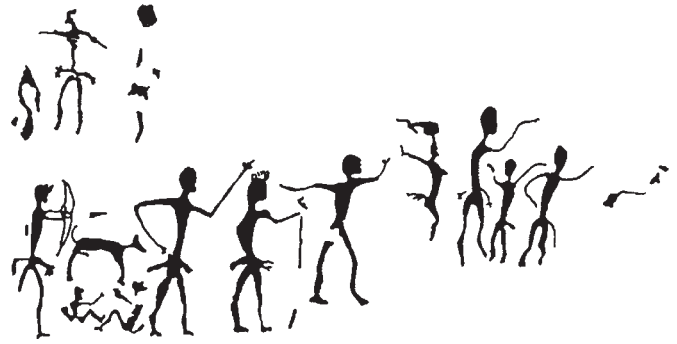
คนและหมาศึกดีลิตี๊ ราว 3,000 ปีมาแล้ว ที่เขาจันทน์งาม อ. สี่คิ้ว จ. นครราชสีมา (ซ้าย) ภาพถ่ายจากเขาจันทน์งาม (ขวา) ไล่เส้นคัดลอก