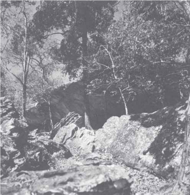
เพิงผาลำปางสมัยถ้ำช้างสี (ถ้ำตาลาว) บ้านไทรงาม ต. ไทรงาม อ. เขมราฐ จ. อุบลราชธานี