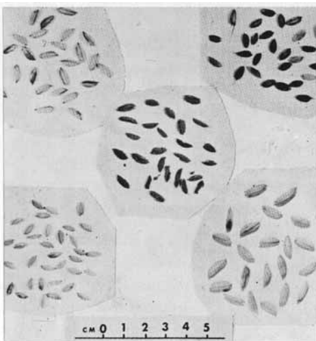
เมล็ดข้าว 5,000-7,000 ปีมาแล้ว จากถ้ำปุงสูง จ. แม่ฮ่องสอน (กลุ่มกลาง) เปรียบเทียบพันธุ์ข้าว ปัจจุบันทางภาคตะวันออกเฉียงเหนือของประเทศไทย

นอกจากกินข้าวเป็นอาหารหลักแล้ว ผู้คนยุคนี้ยังแสวงหาของกินจากความหลากหลายทางชีวภาพตามธรรมชาติของสุวรรณภูมิด้วย จากการขุดค้นทางโบราณคดีพบว่ามีกระดูกสัตว์และซากพืชพันธุ์ฝังรวมในหลุมศพ