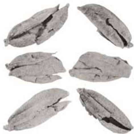
เปลือกข้าว 5,000-7,000 ปีมาแล้ว ที่ขุดได้จากถ้ำปุงสูง จ. แม่ฮ่องสอน แสดงรอยแตกแบบเดียวกับเปลือกข้าวที่แตกจากการตำแล้วมีคเอาเปลือกออก