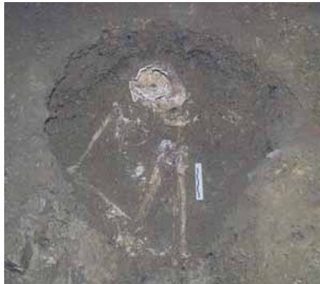
โครงกระดูกมนุษย์ ขุดพบที่เพิงผาถ้ำลอด จ. แม่ฮ่องสอน

สภาพแวดล้อมไม่แตกต่างจากปัจจุบันมากนัก แต่จะมีความหนาแน่นของพืชพรรณในป่าและความชุกชุมของสัตว์ป่ามากกว่าปัจจุบัน