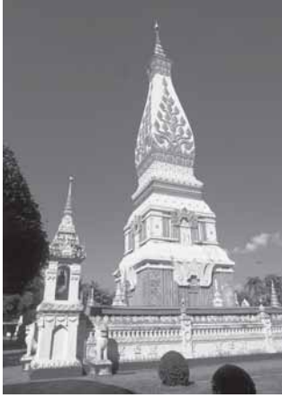
พุทธศาสนาสุวรรณภูมิแพร่หลายถึงสองฝั่งแม่น้ำโขงราว หลัง พ.ศ. 1000 เห็นได้จากรากฐานเดิมของสถูปที่พระธาตุพนม อ. ธาตุพนม จ. นครพนม