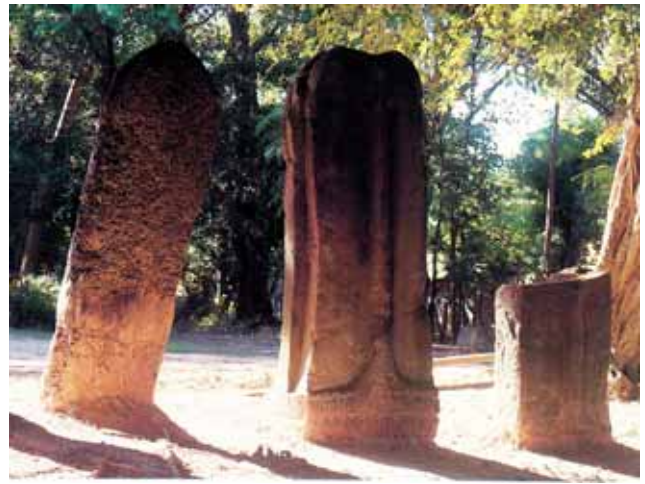
เสมาหินทราย บนคอนเจ้าปู่บ้านพระโรจน์ อ. ม่วงสามสิบ พบอยู่ประมาณ 3-4 หลัก ที่น่าสนใจคือ หลักใหญ่ซึ่งสลักรูปสถูป อยู่ตรงกลางเหนือฐานบัวคว่ำบัวหงายด้วยการใช้ลายเส้นงดงาม อาจจัดเป็นเสมาหินในรุ่นพุทธศตวรรษที่ 12-13 ซึ่งแสดงความได้ เห็นการนับถือพุทธศาสนาเป็นหลักของชุมชนในท้องถิ่น