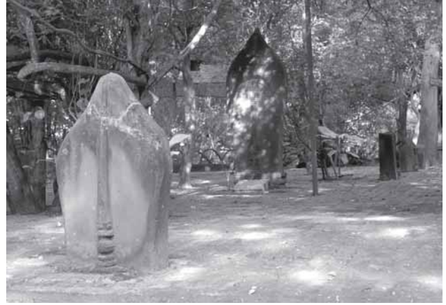
โบสถ์มา วัดโพธิ์ศิลา บ้านเปือยหัวตง อ. ลืออำนาจ จ. อำนาจเจริญ