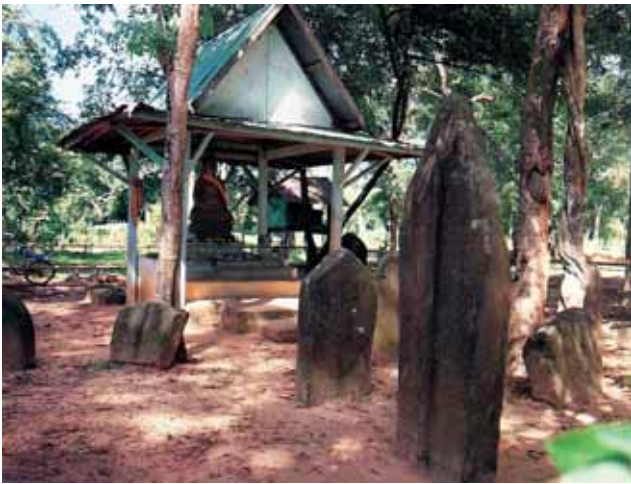
กลุ่มเสมาหินทราย หลังโรงเรียนชุมชนบ้านเปือยหัวตง ปัก ล้อมฐานหินทรายที่ตั้งรูปเคารพและพระพุทธรูปนั่งขัดสมาธิราบ สมัยทวารวดีองค์หนึ่ง ลักษณะของเสมาเรียบไม่มีลวดลายแบบ เดียวกับที่พบตามลุ่มน้ำชีทั่วไป