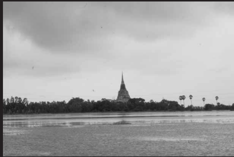
น้ำท่วมนาข้าวบริเวณทุ่งภูเขาทอง จังหวัดพระนคร ศรีอยุธยา เมื่อ พ.ศ. 2538