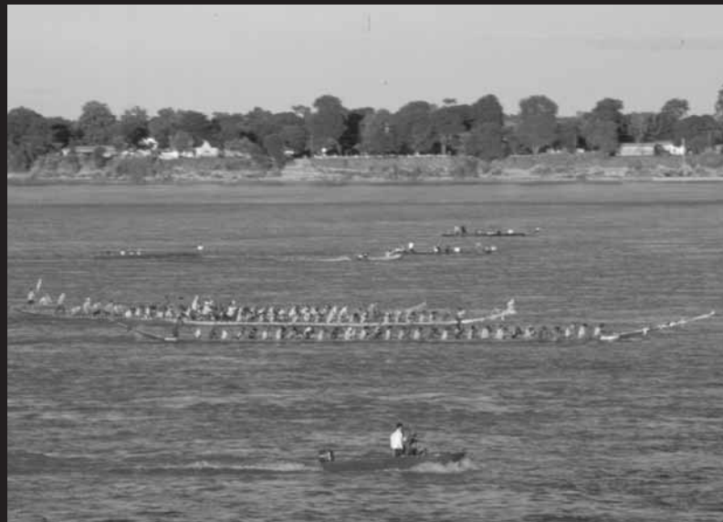
แข่งเรือไทย-ลาวในแม่น้ำโขง จังหวัดมุกดาหาร เมื่อ พ.ศ. 2537