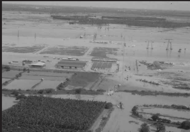
น้ำท่วมนาข้าวจังหวัดพระนครศรีอยุธยา เมื่อวันที่ 4 ตุลาคม พ.ศ. 2539