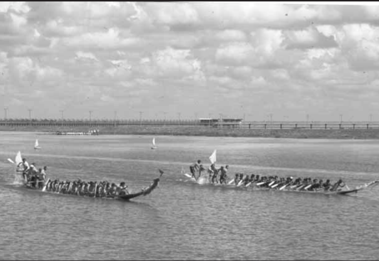
แข่งเรือในหนองหานหลวง จังหวัดสกลนคร