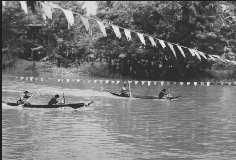
ชาวบ้านแข่งเรือ