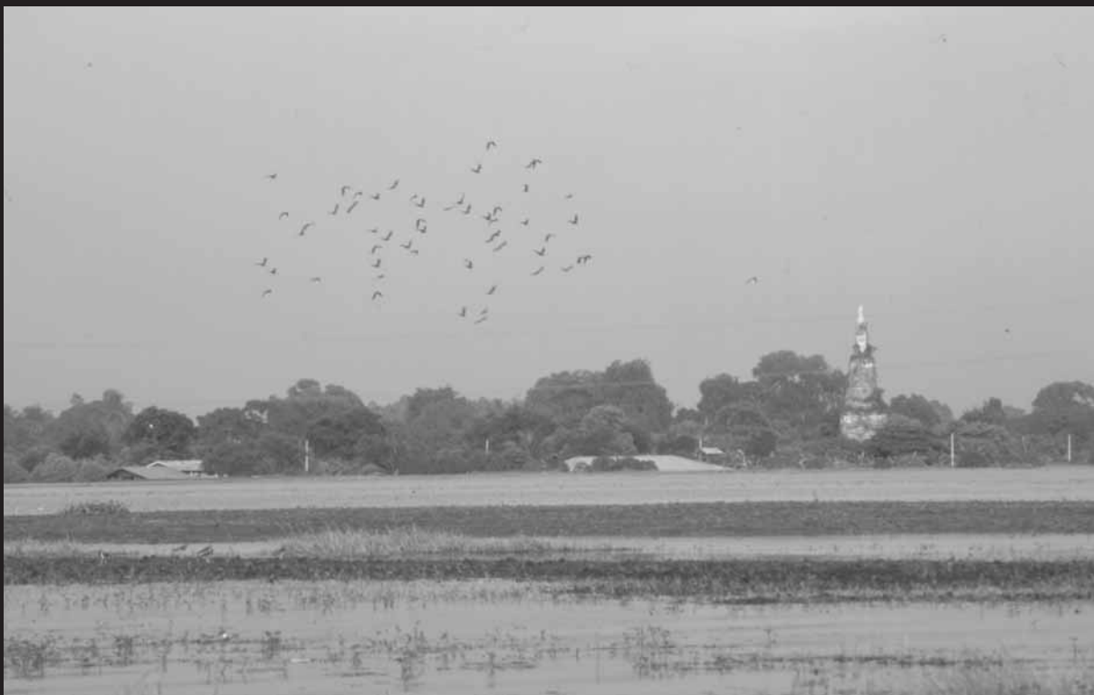
น้ำท่วมนาข้าวบริเวณทุ่งลุมพลี จังหวัดพระนครศรีอยุธยา เมื่อวันที่ 29 กันยายน พ.ศ. 2538