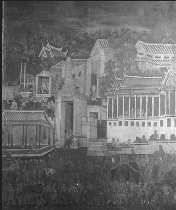
ถวายเป็นพระราชกุศลหลวงทางสถลมารค พระราชพิธีเดือนสิบเอ็ด จิตรกรรมฝาผนังในพระอุโบสถ วัดราชประดิษฐสถิตมหาสีมาราม กรุงเทพฯ เขียนในสมัยรัชกาลที่ 5