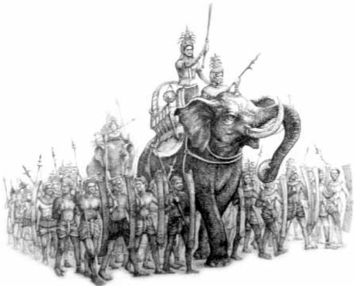
ขุนเจ็อง รูปเขียนจากจินตนาการ ปัจจุบันจัดแสดงอยู่ที่ห้องก่อนจะเป็นลานนา หอวัฒนธรรมนิทัศน์ วัดศรีโคมคำ จังหวัดพะเยา