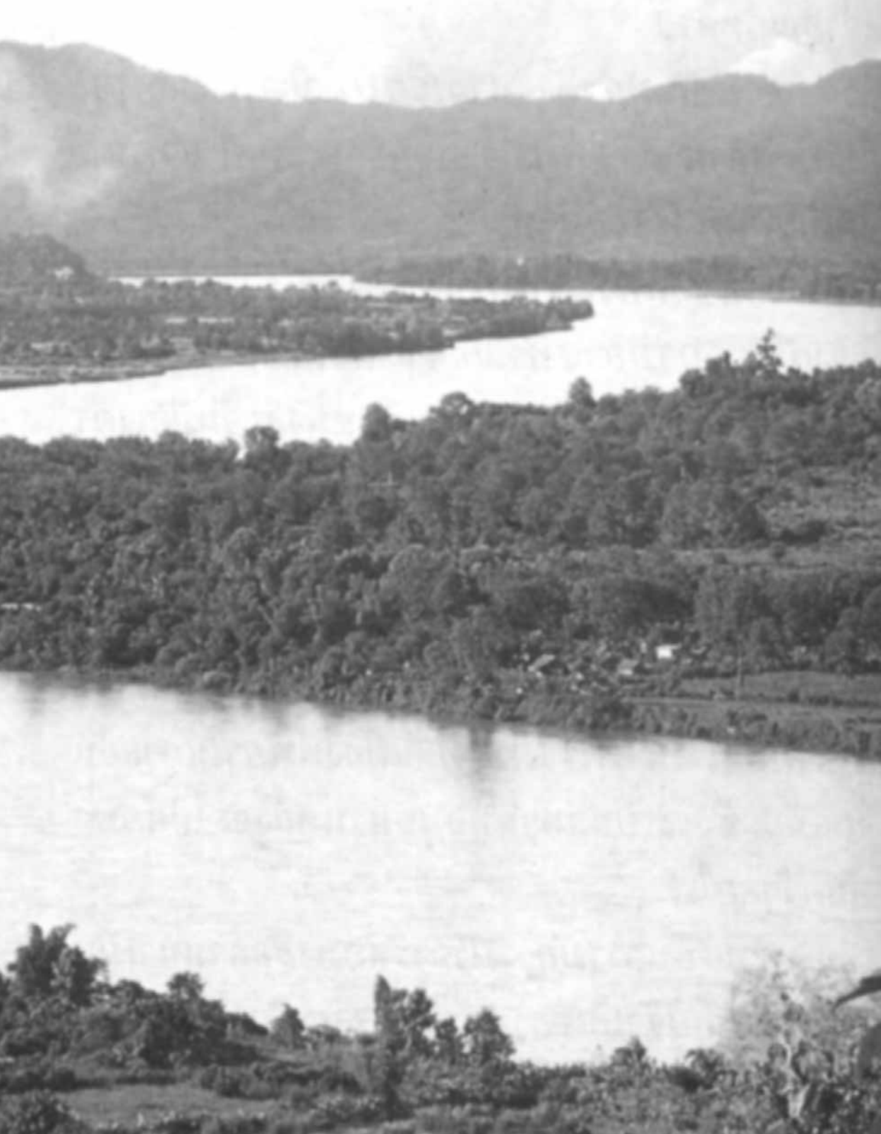
แม่น้ำโขง ช่วงที่ไหลคดโค้งผ่านเมืองเชียงแสน อำเภอเชียงแสน จังหวัดเชียงราย ในตำนานพญาเจืองเรียกชื่อเมือง “หิรัญนครเงินยาง” (ภาพถ่ายเมื่อราว พ.ศ. ๒๕๓๘)